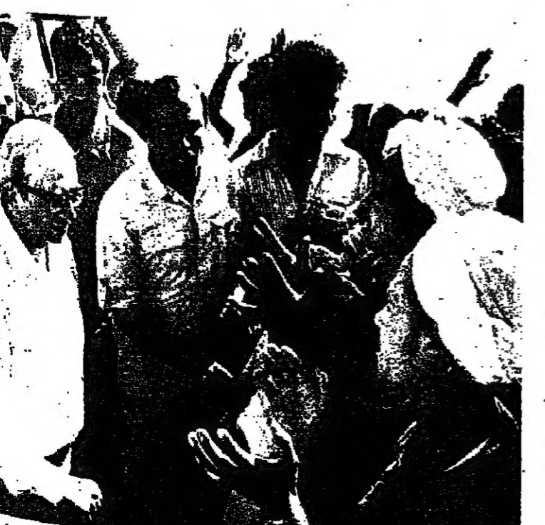
سكان قرية ميت ابو الكوم في استقبال رئيس الدولة السيد اسحق ناسون .